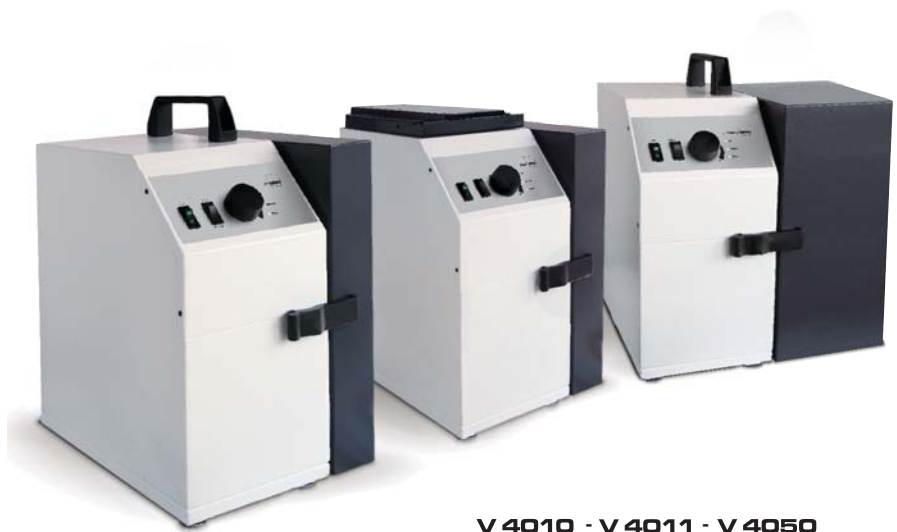
V 4010 - V 4011 - V 4050