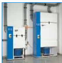
FZ VARIO Zentrale Absaugsysteme