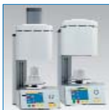
VP 300, V 300 Keramikofenserie