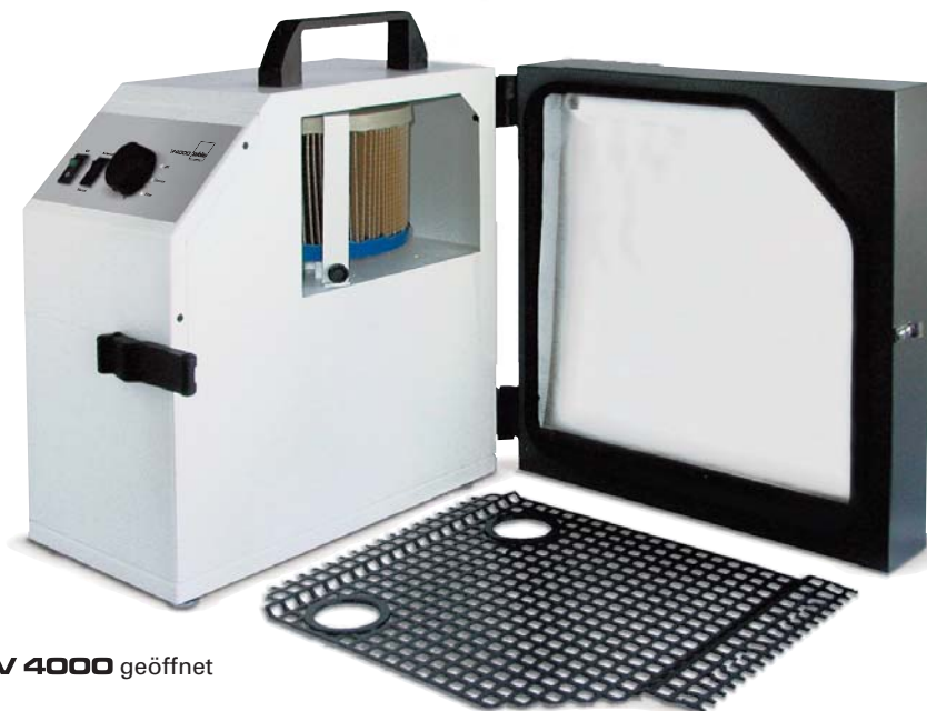
V 4000 geöffnet